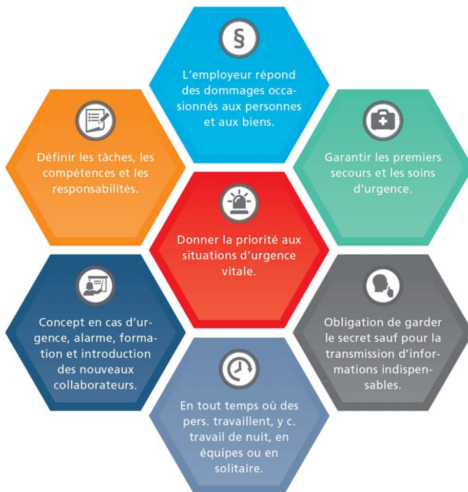
Illustration 336-2 : Les éléments du concept en cas d'urgence